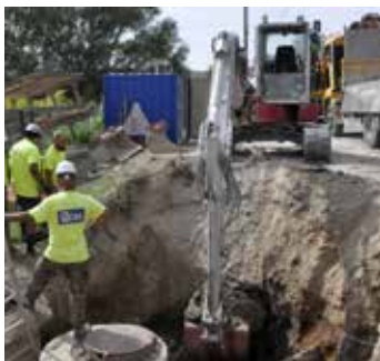
Route de la Gare : renforcement du réseau des eaux usées.