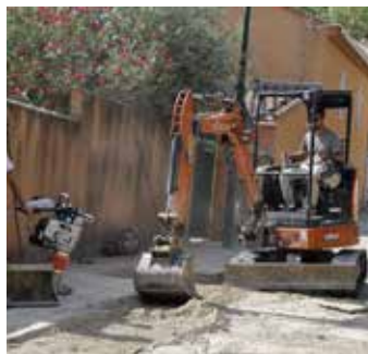
Rue Perrolane : poursuite de la réfection du réseau des eaux usées.