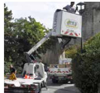
Rue de la Glacière : remplacement des luminaires suivant le programme de rénovation de l'éclairage public (LED).