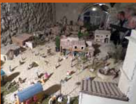
Une vue partielle de la crèche

Renseignements auprès du secrétariat de la mairie (04 90 22 41 10).