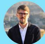
Etienne Klein Maire

Je vous souhaite à toutes et à tous une très belle année et vous donne rendez-vous le 14 janvier à 18h30, à l'Arbousière, pour la traditionnelle cérémonie des vœux..