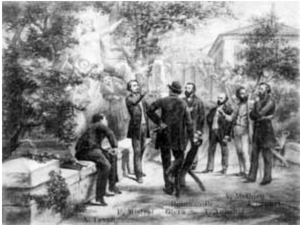
Les Primadié dans le parc de Fonségugne