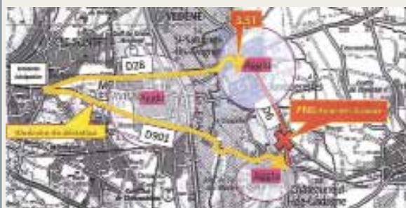
PN 6 ci-dessus - PN 8 à droite

Les itinéraires de déviation figurent sur les cartes ci-après.