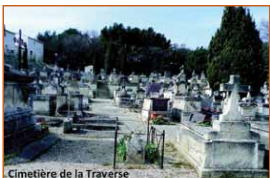
Cimetière de la Traverse

Le règlement de ce cimetière sera élaboré huit ans plus tard : les concessions auront de 2 à 5 m 2 , et les tombes, entre les rangées de tombeaux bâtis, ne devront être entourées que par des clôtures amovibles. Trente-cinq concessions seront vendues à cent cinquante francs chacune. Quatre membres du Conseil désigneront les emplacements. La translation des tombes, de l'ancien au nouveau cimetière, sera au frais des concessionnaires, ainsi que la construction des tombeaux.