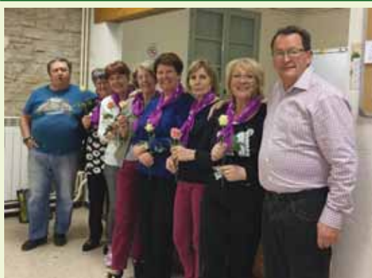
Les membres du nouveau bureau

A l'occasion du jeu de société qui s'est déroulé le 8 mars, « journée de la femme », une rose à été offerte à chacune des adhérentes.