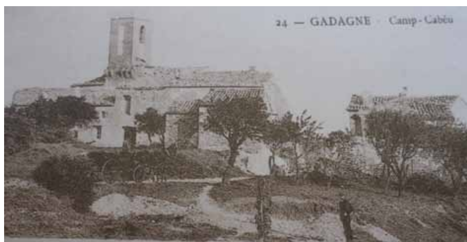
Le plateau de Campbeau en 1840

Plusieurs années plus tard, lors de la construction de la ligne de chemin de fer (1864), les entrepreneurs prendront les matériaux au plus près, parfois sans autorisation, ce qui entraînera la protestation du Conseil municipal, dans sa séance du 5 juillet 1868 : « La Compagnie du chemin de fer a obtenu du Préfet l'autorisation d'occuper provisoirement des terrains communaux au quartier des Garriguettes, désignés sous le nom de Campbeau, pour y extraire une grande quantité de gravier destiné au remblai de la voie en construction. Le Conseil, sur la proposition du maire, considérant que l'extraction importante de gravier ne peut manquer de détruire la plus belle place de la commune. Considérant que dans le cas où la commune serait obligée de supporter malgré elle l'occupation qu'elle redoute, et que, en opérant l'extraction du gra-