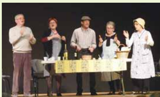
Une saynète jouée lors de la Vihado de mars

Entrée gratuite. Ne manquez pas cette rencontre.