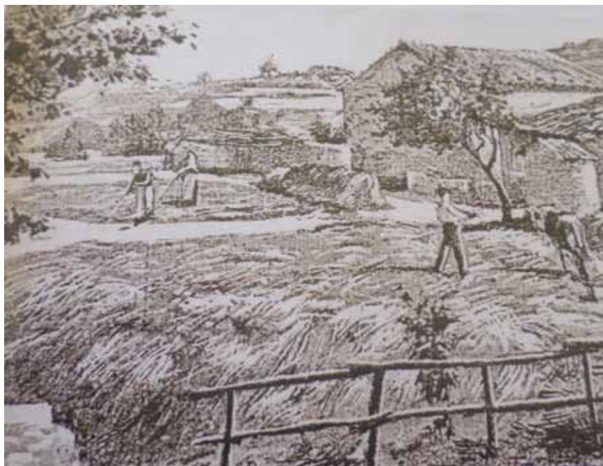
Les aires de foulage sur le plateau de Campbeau

Il demandera en même temps le paiement du charroi des pierres « qu'il a fait enlever dans ce quartier », et qui sont vraisemblablement celles des remparts du côté de Campbeau.