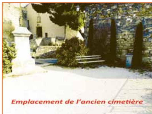
Emplacement de l'ancien cimetière

Le 20 mars 1838, le Conseil municipal décida de transférer le cimetière, qui se trouvait jusqu'alors près de l'église (sur l'actuel belvédère de la Croix de Mission) à l'étroit dans ses 115 m 2 . Un siècle auparavant, le duc de Gadagne l'avait déjà fait repousser hors de l'enceinte du château.