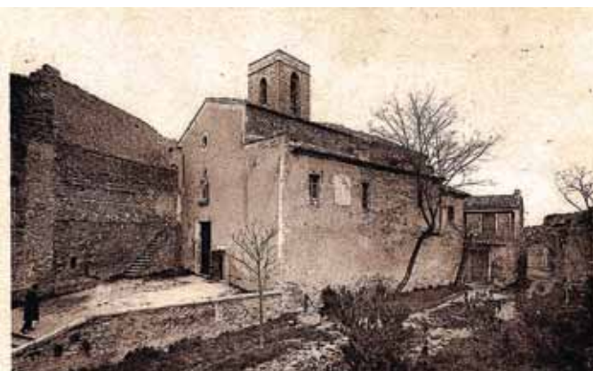
L'église aux environs de 1830

Le poste télégraphique installé fonctionna dès 1832, avec Cavaillon (colline Saint-Jacques et Saint-Saturnin).