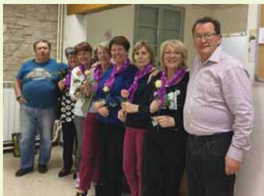
Les membres du nouveau bureau

A l'occasion du jeu de société qui s'est déroulé le 8 mars, « journée de la femme », une rose à été offerte à chacune des adhérentes.