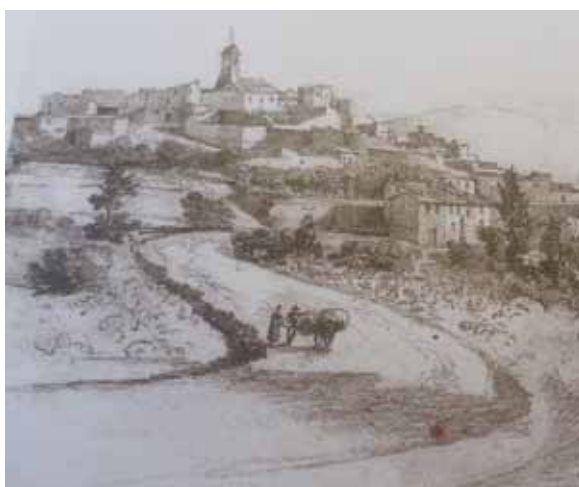
Le télégraphe Chappe au sommet du clocher en 1834

Mais le maire jugea que « le clocher de l'église étant un monument qui date au moins du X e siècle, dont la vétusté menace la ruine, et que sur la façade Est existe une lézarde qui va des fondations au faite, le conseil est d'avis que le poste ne soit plus établi sur le clocher, du moins jusqu'à ce que les réparations nécessaires aient été faites ».