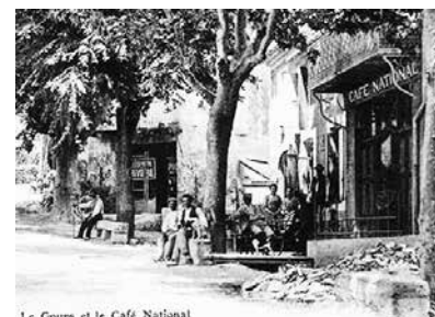
Le Cours et le Café National