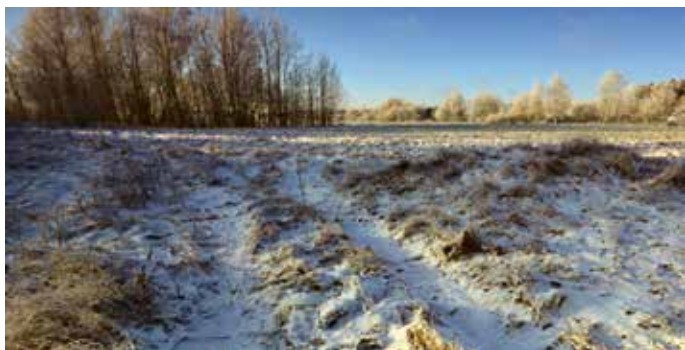
De fortes gelées matinales dans la plaine

Mail il faut ajouter la terrible gelée du 14 au 15 mai 1876 qui, comme l'écrit le maire au Préfet, a « complètement brûlé les mûriers, qui ne peuvent donner aucun produit pour l'éducation des vers à soie. L'espérance de toute récolte de cocons se trouve de ce fait anéantie. Le blé plus ou moins atteint par le même fléau, dans différentes régions de notre terroir, ne donnera qu'un produit bien au-dessous de la moyenne aux nombreux fermiers qui s'occupent de son exploitation. Enfin, la pomme de terre et les fruits de toutes espèces, ont été littéralement gelés dans cette nuit fatale. La commune de Gadagne déjà durement éprouvée par la perte de la garance et de la vigne, est aujourd'hui dans une situation qui mérite l'intérêt »