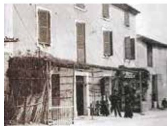
Le Café de France (sur la départementale) était celui des Blancs

A Gadagne, il faudra cent ans pour voir s'apaiser peu à peu ces divisions qui marqueront les élections, et même les lieux de rassemblement : le cercle des « blancs » opposé au café des « rouges ».