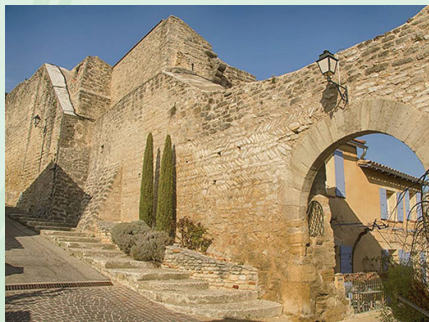
Les murailles du château et la Tour du Jas