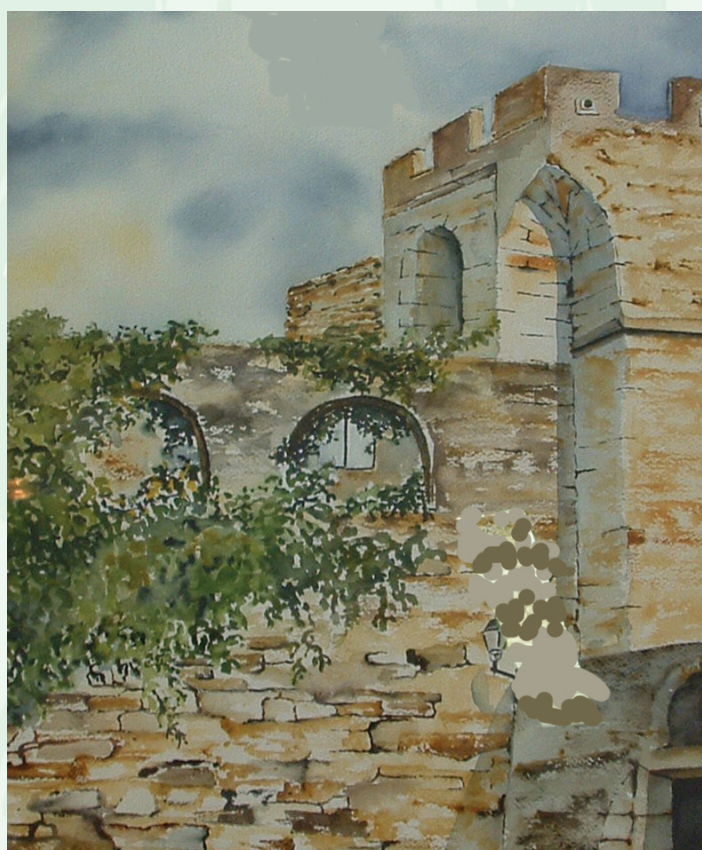
Une vue du château actuel (aquarelle de Véronique Fournet - 2007)

Les restaurations successives qui ont été entreprises depuis, ne donnent aucune idée de ce qu'était sa taille autrefois, ni de son importance.