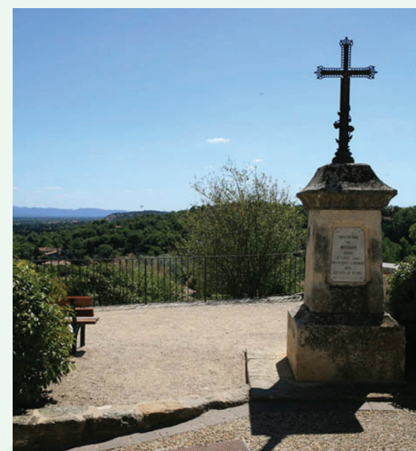
La croix de mission et l'emplacement du cimetière ancien

A l'est, les murailles bordaient la rue de la Glacière et, à l'ouest débordaient la plateforme du parvis de l'église. Un cimetière y était attenant, là où se trouve l'actuelle croix de mission.