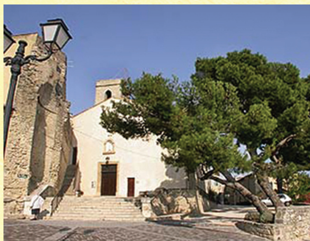
On aperçoit, à gauche, la tour creuse démolie partiellement

Dans le transept sud se trouve la chapelle du château, à partir de laquelle l'église fut construite. Dans cette chapelle sont enterrés les seigneurs du village : les Giraud-Amic, les Simiane et presque tous les Gadagne. L'église aurait été construite au début du XIII e siècle. Elle est de style roman. Son chœur, à l'extérieur, est de forme pentagonale, avec un toit en pierre. L'abside est dite en "cul de four". Le 2 août 1562 (Guerres de religion), le baron des Adrets, huguenot, fit incendier l'église et le presbytère attenant. Le prêtre fut massacré. Jusqu'en 1774, on enterra les gens de qualité dans l'église. Le clocher qui portait un toit de tuiles à quatre pentes fut arasé en 1832, pour l'installation d'un poste du télégraphe Chappe.