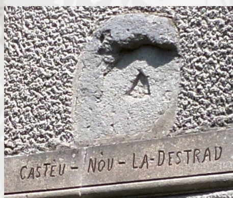
La hache sur une maison de la rue des Bourgades