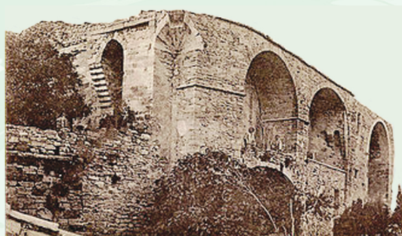
Le vieux château et sa coquille

Age d'or de la construction, le XIIIe siècle permet à la France de se couvrir de cathédrales et aux Châteauneuf de se multiplier. En même temps que notre premier seigneur construisait le nôtre, son cousin Béranger édifiait Châteauneuf Calcernier , aujourd'hui Châteauneuf du Pape.