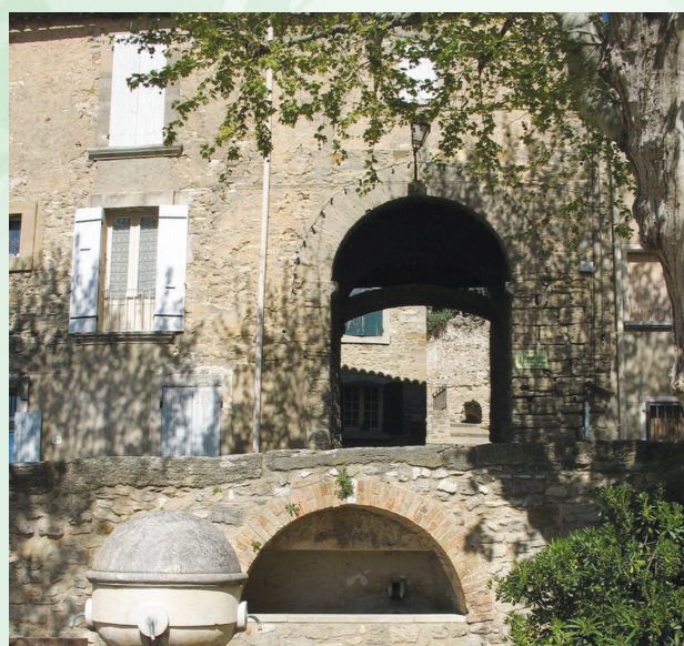
Le Portail Vieux ou Porte de l'Horloge

La situation géographique dominant la plaine constituait une position stratégique de premier ordre, conférant au château le caractère d'une véritable forteresse. Un mur d'enceinte du village fut vraisemblablement construit à la même époque pour la protection des habitants. Il reste encore de beaux vestiges de cette fortification, notamment le Portail Vieux , en face de la Fontaine de l'Orme.