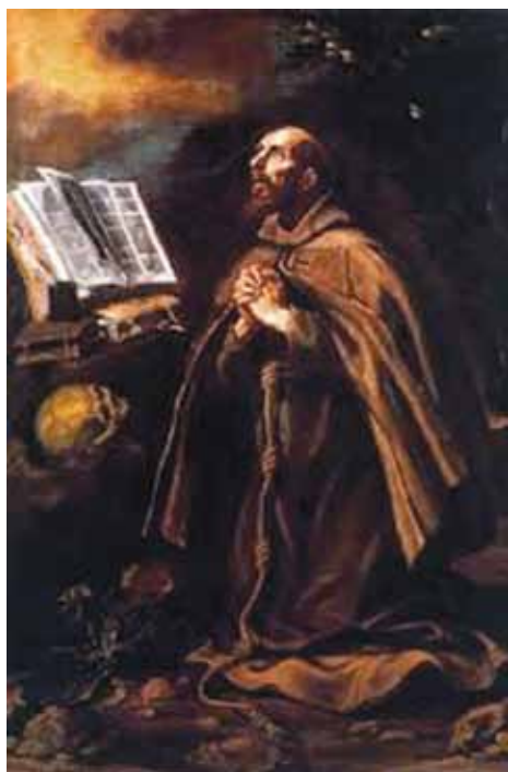
Saint Pierre d'Alcantara. Luis Tristan. Palais archi-épiscopal. Tolède. XVIe.

Saint Pierre d'Alcantara , dont la fête est célébrée le 29 octobre, fonda un ordre religieux militaire et charitable en 1166. Ce saint homme prénommé Pierre (Pedro) était né à Alcantara, ville espagnole sur le Tage.