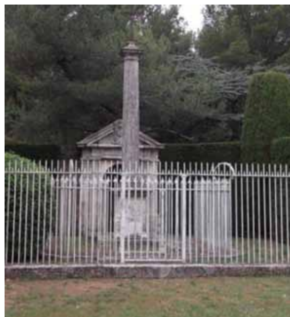
Le Mausolée sur Campbeau

Le Mausolée : il fut construit du vivant de notre bienfaiteur, à la mémoire de ses parents et pour lui servir de sépulture.