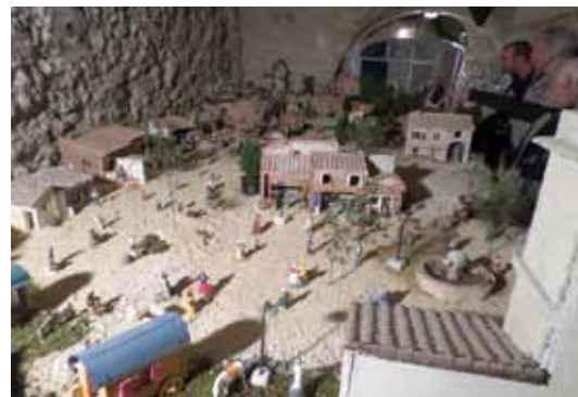
Une vue partielle de la crèche de l'an dernier