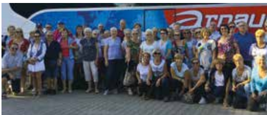
Les participants au voyage aux Cinque Terres