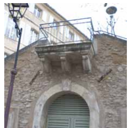
L'arceau de la voûte (?)

Faute d'avoir vu aboutir le projet initial, l'école de filles sera installée dans la maison du fermier (contigüe à la mairie et