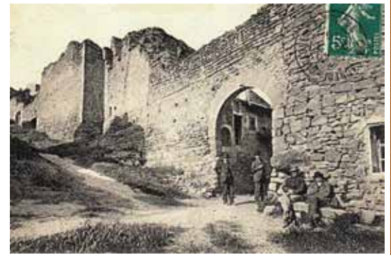
Le chemin qui longeait les remparts