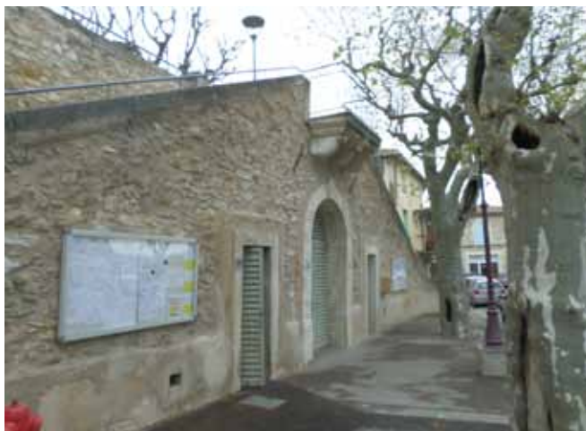
Des platanes à l'emplacement de La Melette

qui a été rasée en 1990 pour construire des logements). Un projet de passage sous la terrasse de la mairie devait permettre « aux filles un accès direct sur la place Goujon, leur entrée sur la Grand-Rue étant trop étroite ». La longueur de cette voûte surmontée d'un arceau de pierre (sans doute celui qui existe sous le balcon de l'escalier de la mairie), devait être de dix mètres et sa hauteur moyenne de 3,50 m. Mais le projet échouera finalement, faute de moyens.