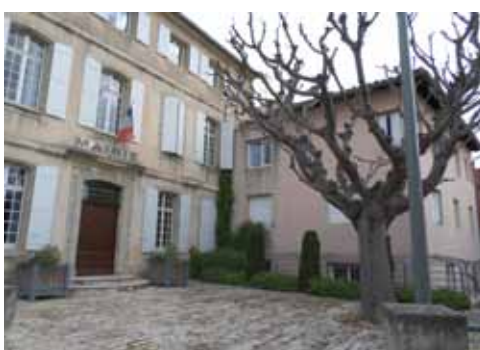
La maison Giéra et l'emplacement de celle du fermier (à droite)

Mais le maire tient à son projet. Il insiste sur le fait que la salle de la mairie de la Grand-Rue dans laquelle se traitent les affaires du pays, est trop petite pour recevoir le Conseil et le public le jour des adjudications, et les électeurs le jour des élections : « que cette salle se trouvant entre deux rues, toutes les affaires qui s'y discutent sont entendues des dehors, et rendues publiques le lendemain, ce qui occasionne de très graves inconvénients ». Une enquête publique est alors organisée, et certains habitants (peu nombreux) souhaiteraient qu'on « réparât plutôt les ponts ». Mais les fonds pour l'acquisition de la maison ne peuvent servir à la voirie. Le