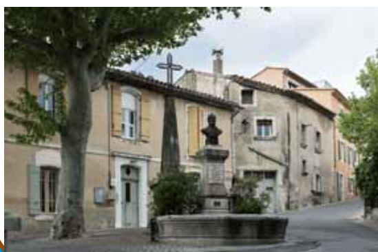
La Fontaine Tavan

L'emplacement de la Pastiche connut d'autres vicissitudes : en 1851, le mur de La Melette qui soutenait les terres de la Pastiche, s'écroula. Il avait été construit en grande partie par voie d'atelier de charité. Il fut reconstruit, cette fois, aux frais de la commune, et une balustrade en fer y fut posée.