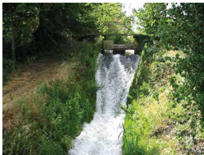
Un ouvrage sur le canal de l'Isle

L'introduction des eaux dans le canal aura lieu dans les premiers mois de l'année 1852. Le volume d'eau introduit dans le canal (4 m 3 /seconde) était particulièrement important, puisqu'il permettait d'arroser 4 000 ha. Il apporte alors un progrès manifeste, qui amène l'espérance de prospérité aux membres de l'association de l'Isle. 15 km de canal principal sont creusés, desservant 80 filioles (petits canaux) représentant 180 km de réseau secondaire. Trente-deux de ces filioles s'en séparent pour arroser notamment Châteauneuf de Gadagne, Caumont et une partie du Thor non traversée par le canal.