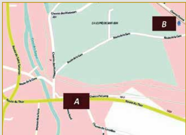
L'emplacement souhaité par la municipalité (A) et celui finalement choisi par la Compagnie du Chemin de Fer (B).

Pour ces motifs, émet le vœu que la ligne d'Avignon à Gap, passe par Gadagne et qu'une gare soit établie au pied de ce village, pour desservir les nombreux intérêts dont il s'agit ».